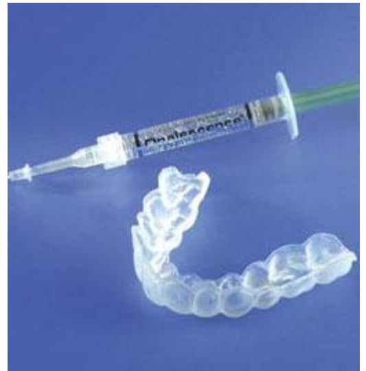
Van de tandarts of mondhygiënist krijgt u de doorzichtige bleeklepel en de gel met de blekende werking mee naar huis

Egale, niet te ernstige verkleuringen kunnen van buitenaf worden gebleekt. Dat gebeurt met behulp van een bleeklepel. Eerst maakt uw tandarts of mondhygiënist een afdruk van uw gebit. Hierop maakt de tandtechnicus in het tandtechnisch laboratorium een bleeklepel. Deze wordt gemaakt van een zachte kunststof, specifiek voor uw gebit. Dat is belangrijk, want dan past de lepel goed en wordt uw tandvles goed beschermd tegen de blekende stof (peroxide). U krijgt de bleeklepel en de gel met de blekende werking mee naar huis. Daarom wordt dit ook wel 'thuisbleken' genoemd. Uw tandarts geeft aan hoe lang u de bleeklepel met de gel moet dragen voor het gewenste resultaat. Meestal zult u de bleeklepel 's nachts dragen. Afhankelijk van de verkleuring ziet u na enkele dagen of weken resultaat. Tijdens het bleken, kunnen uw tanden en tandvles tijdelijk gevoelig worden. Raadpleeg uw tandarts als deze klacht optreedt.