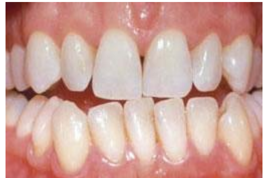
Resultaat na tien dagen bleken met de thuisbleekmethode onder begeleiding van de tandarts

De lengte van een bleekbehandeling hangt af van de bleekmethode. Bij de thuisbleekmethode duurt het meestal twee weken voordat u een gewenst resultaat bereikt.