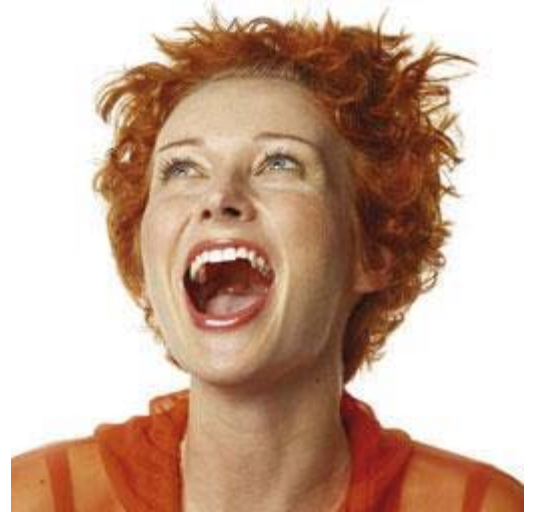
Het bleekresultaat verschilt voor iedereen

Het bleekresultaat verschilt voor iedereen. De basiskleur van uw tandbeen bepaalt voor een belangrijk deel het uiteindelijke resultaat. En die basiskleur is bij iedereen anders. Het bleekresultaat is soms niet blijvend. In een aantal gevallen komt de verkleuring na een paar jaar weer terug. De vorming van tandbeen gaat namelijk gewoon door. Ook gebleekte tanden zullen, net zoals niet-gebleekte tanden, op den duur verkleuren door veroudering. Dit proces gaat sneller als u rookt of bepaalde voedingsstoffen veel gebruikt. Het effect van langdurig of herhaald bleken op het tandweefsel is niet helemaal bekend.