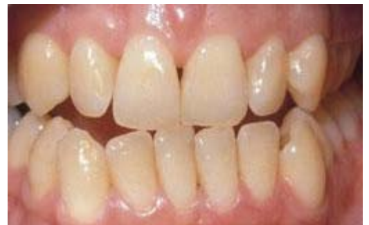
Voor het bleken