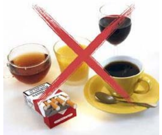
Tijdens de behandeling met de bleeklepel is het gebruik van deze producten af te raden

Door het bleken, wordt het glazuur van de tanden en kiezen iets poreuzer. Dat is tijdelijk. Het glazuur herstelt zich weer. Tijdens de behandeling met de bleeklepel kunnen bepaalde etenswaren en dranken het resultaat nadelig beïnvloeden. Voorbeelden daarvan zijn koffie, thee, rode wijn, koolzuurhoudende frisdranken, citrusvruchtensap en kleurstof bevattende etenswaren (zoals vruchtenjam). Tijdens de behandeling is het gebruik van deze producten, evenals roken, af te raden.