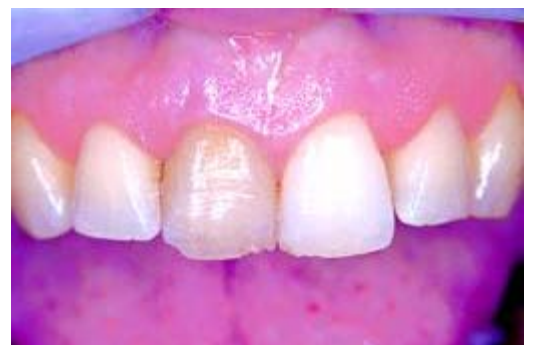
Verkleuring door een dode tand