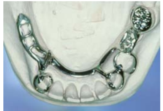
Frameprothese in wording op een gipsmodel, zonder kunsttanden en -kiezen

De frameprothese is gemaakt van metaal. Op het metaal is een tandvleeskleurige kunsthars aangebracht. Daarop zitten de kunsttanden of -kiezen. De frameprothese rust vooral op een deel van de overgebleven tanden of kiezen. Afhankelijk van het ontwerp rust de frameprothese ook meer of minder op het slijmvlies. De tandarts kan de frameprothese op twee manieren bevestigen. Of met metalen ankertjes die om enkele tanden of kiezen klemmen of met een soort slotje. Bij een slotje wordt de ene kant vastgemaakt aan een kroon, tand of kies en de andere kant zit vast aan de frameprothese. De frameprothese kunt u op die manier in het slotje schuiven. Het slotje zit doorgaans aan de binnenkant van de tanden en kiezen en is dus niet vanaf de buitenkant zichtbaar. Ankertjes zijn vaak wel enigszins zichtbaar.