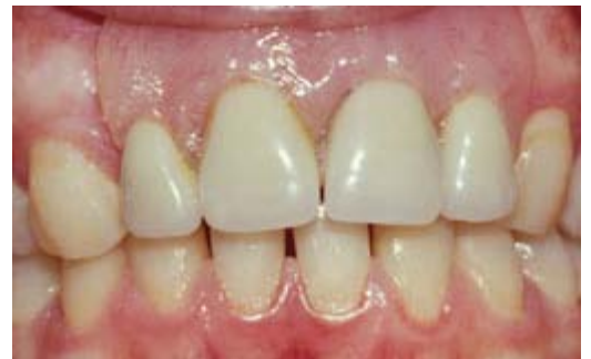
Plaatprothese van voren

De plaatprothese is gemaakt van een roze, tandvleeskleurige kunsthars. Daarin zijn de kunsttanden en kiezen verankerd. De gehele plaatprothese rust op het slijmvlies van de mond. Deze zit eventueel met ankertjes vast aan overgebleven tanden of kiezen.