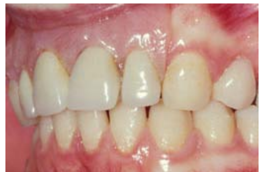
Plaatprothese van opzij