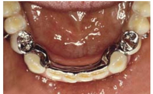
Frameprothese met verankering op kronen