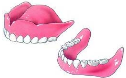
Tanden en kiezen zijn belangrijk voor het kauwen, het spreken en het uiterlijk

Een nieuw kunstgebit is een grote verandering. Uw nieuwe kunstgebit speelt een belangrijke rol bij het kauwen en spreken. Bovendien zijn uw kunsttanden erg belangrijk voor uw uiterlijk. Uw tanden zijn immers uw eerste blikvanger. Zie ook Overkappingsprothese .