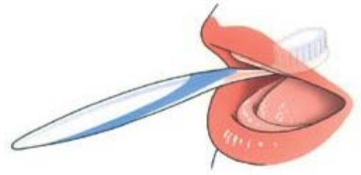
Maak ook uw gehemelte schoon

advies. Leg uw kunstgebit sowieso één keer per week een nachtje in een reinigingsmiddel. Hiermee voorkomt u de vorming van tandsteen op uw kunstgebit. Borstel uw kunstgebit daarna goed en spoel het af met water. Leg uw kunstgebit nooit in heet water en gebruik zeker geen bleekwater of schuurmiddelen.