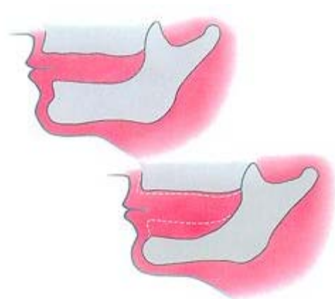
Het slinken van uw kaken gaat heel ongemerkt

Er zijn allerlei kleefpasta's, kleefpoeders en 'voeringen' op de markt om een kunstgebit meer houvast te geven. Die middelen zijn eigenlijk allemaal noodoplossingen. De oorzaak van het probleem wordt niet echt weggenomen. Doe nooit watjes onder uw kunstgebit. Uw kaken gaan daarvan alleen maar sneller slinken. Gaat uw kunstgebit loszitten? Ga dan naar uw behandelaar. Hij ziet meestal direct wat er aan de hand is en kan u het beste advies geven.