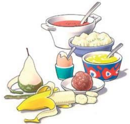
Begin de eerste dagen met zacht voedsel

NB. Dit kan een tandarts zijn of een tandprotheticus. Een tandprotheticus is een tandtechnicus die gespecialiseerd is in het maken van kunstgebitten.