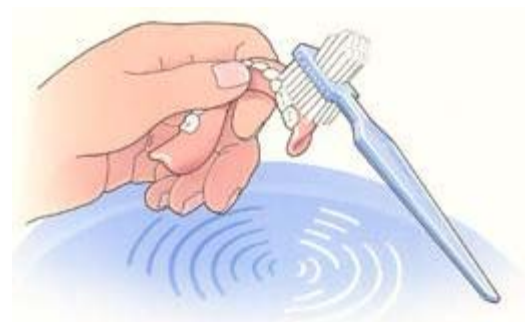
Reinig uw gebit na iedere maaltijd