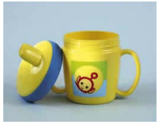
Laat uw kind vanaf 9 maanden uit een beker drinken

Zuigen is een natuurlijke, instinctmatige behoefte van een baby. Kinderen zuigen graag op hun duim of op een speen. Meestal levert dit geen problemen op voor het melkgebit. Pas als de eerste snijtanden van het blijvend gebit doorbreken, kan duimen schadelijk zijn. Dan kan uw kind de boventanden van het blijvend gebit en de kaak naar voren duwen. Als uw kind gaat duimen, kunt u het beter een speen geven. Een speen kunt u natuurlijk gemakkelijk weghalen. Een kind stopt zijn duim sneller en vaker in de mond dan een speen. Daarom leert een kind het gebruik van een speen meestal gemakkelijker af. Probeer zowel het duim- of speenzuigen van uw kind zo vroeg mogelijk af te leren, in ieder geval vóór het doorbreken van het blijvend gebit. Geef bijvoorbeeld iets in handen of leid uw kind overdag af.