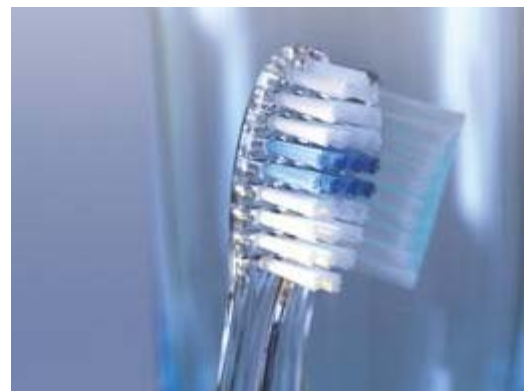
Gebruik een zachte tandenborstel

Poets twee maal per dag uw tanden en kiezen zorgvuldig met een zachte tandenborstel. U oefent voldoende druk uit als u de borstel aan het eind van het handvat vasthoudt tussen uw duim en de toppen van uw vingers. Poets alle plekken in de mond even goed. De eerste tand of kies die u poetst slijt vaak het meest. Als u tandenstokers of ragers gebruikt, beperk dit dan tot één keer per dag. Eet of drink één uur voordat u uw tanden poetst geen zure producten.