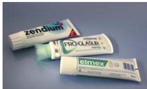
Gebruik een niet-schurende tandpasta

Uw gevoelige tanden kunnen het gevolg zijn van blootliggende tandhalzen. Als uw maatregelen tegen slijtage niet helpen, kan uw tandarts een laklaagje aanbrengen. Maar in de meeste gevallen is een behandeling door de tandarts niet nodig.