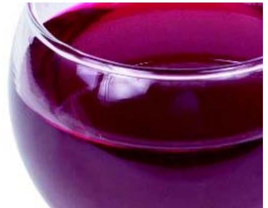
Zuur zit onder andere in wijn ...

Zuren in voeding en dranken kunnen tanderosie veroorzaken. Zuur zit onder andere in (sinaas)appels, citroenen, grapefruit, kiwi's, vruchtensappen, (light)frisdranken (ook ijsthee), wijn en bijvoorbeeld breezers. Tanderosie is een sluipend proces dat niet gemakkelijk te herstellen is. Het gaat niet alleen om hoevéél zure producten u eet en drinkt. Het gaat vooral om hoe vaak, hoe lang, de tijdstippen en de manier waarop u dat doet. Wanneer tanderosie niet wordt bestreden, kunnen zuren het tandglazuur en vervolgens zelfs het blootliggende tandbeen oplossen. Zie verder wat veroorzaakt tanderosie?