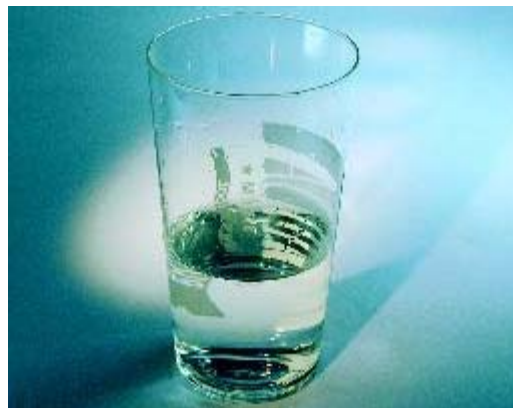
Neutraliseer zuur met water, melk of kaas