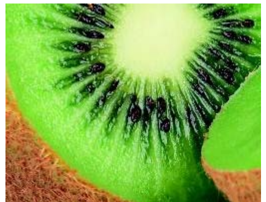
... in kiwi's en in citrusvruchten