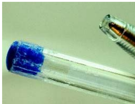
Probeer verkeerde gewoonten, zoals kluiven op een pen of potlood, af te leren