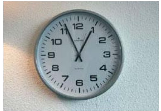
Eet of drink één uur voor het tandenpoetsen geen zure producten

Het oppervlak van tanden en kiezen wordt zachter door de inwerking van zuur. Als u direct na het eten of drinken van zuur uw tanden poetst, kunt u de glazuurlaag gemakkelijk wegpoetsen. Dan slijt uw gebit dus nog sneller.