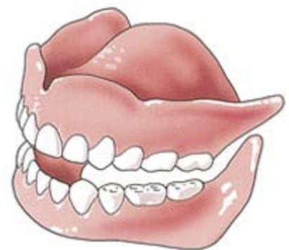
Tanden en kiezen zijn belangrijk voor het kauwen, spreken en het uiterlijk