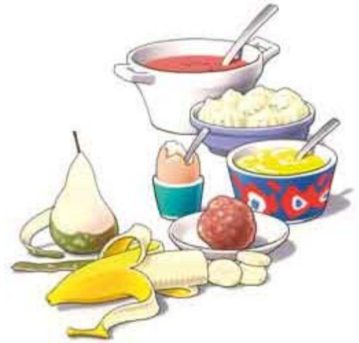
Begin de eerste dagen met zacht voedsel

aardappel. Weer later kunt u voedsel eten zoals vlees of een appel. Stukken afbijten kunt u met een kunstgebit beter niet doen. Snijd uw voedsel daarom in stukjes en kauw rustig en gelijkmatig met uw nieuwe kunstkiezen. Neem daarbij aan beide zijden een stukje voedsel in de mond. Neem er iets meer tijd voor dan dat u gewend was.