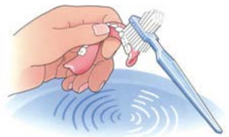
Reinig uw prothese na iedere maaltijd

Uw kunstgebit is nu nog nieuw en mooi. Dat wilt u natuurlijk graag zo houden. Daarom moet u, net als bij eigen tanden en kiezen, uw kunstgebit verzorgen. Als u het niet regelmatig schoonmaakt, blijven er voedselresten achter. Zowel op uw kunstgebit als eronder. Als u die niet verwijdert, kan uw tandvlees op den duur gaan ontsteken. Reinig uw gebit daarom zorgvuldig na iedere maaltijd. Gebruik een speciale protheseborstel, bijvoorbeeld van Lactona of Oral-B, en water om etensresten goed te verwijderen. Gebruik géén tandpasta. Die kan te veel schuren. Een schoon kunstgebit voelt altijd glad aan. Laat uw gladde gebit tijdens het reinigen niet uit uw handen glijpen. Het zal kapot gaan. Vul voor de zekerheid eerst de wasbak met water en reinig uw gebit daarboven.