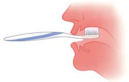
Maak ook uw gehemelte schoon

Na verloop van tijd bent u gewend aan uw nieuwe kunststanden en -kiezen. Zo goed zelfs, dat het lijkt alsof ze er altijd zijn geweest. Maar dat blijft niet zo. Uw mond verandert omdat uw kaken slinken.