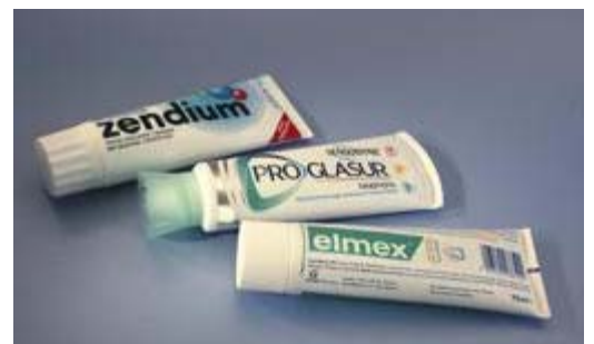
Gebruik een niet-schurende tandpasta

Poets ook met een elektrische tandenborstel uw tanden tweemaal per dag met een fluoridetandpasta.