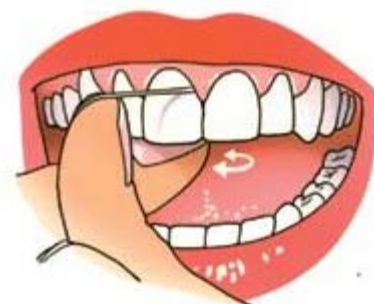
Trek de draad strak om de tand of kies

3. Trek de draad na het contactpunt strak om de tand of kies. Breng de draad onder het tandvlees totdat u weerstand voelt. Het mag geen pijn doen. Haal de draad dan, terwijl die contact houdt met de zijkant van de tand of kies, met korte heen-en-weergaande bewegingen terug tot het contactpunt.