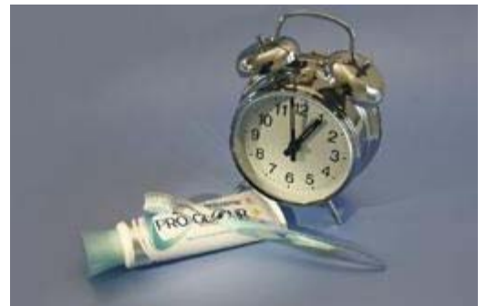
Gebruik geen zure producten één uur voor het tandenpoetsen

Fluoride maakt tandglazuur sterker en minder goed oplosbaar in zuur. Gebruik dus een tandpasta met fluoride. Ga voor de spiegel staan, dan houd je meer zicht op het poetsen.