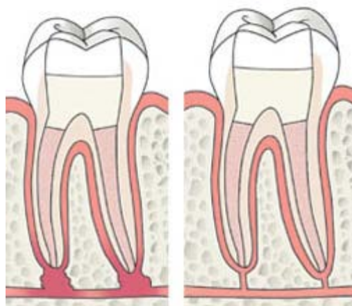
3 Wortelkanalen zijn afgesloten met vulmateriaal en de kies is voorzien van een vulling 4 Geruime tijd later is de ontsteking verdwenen